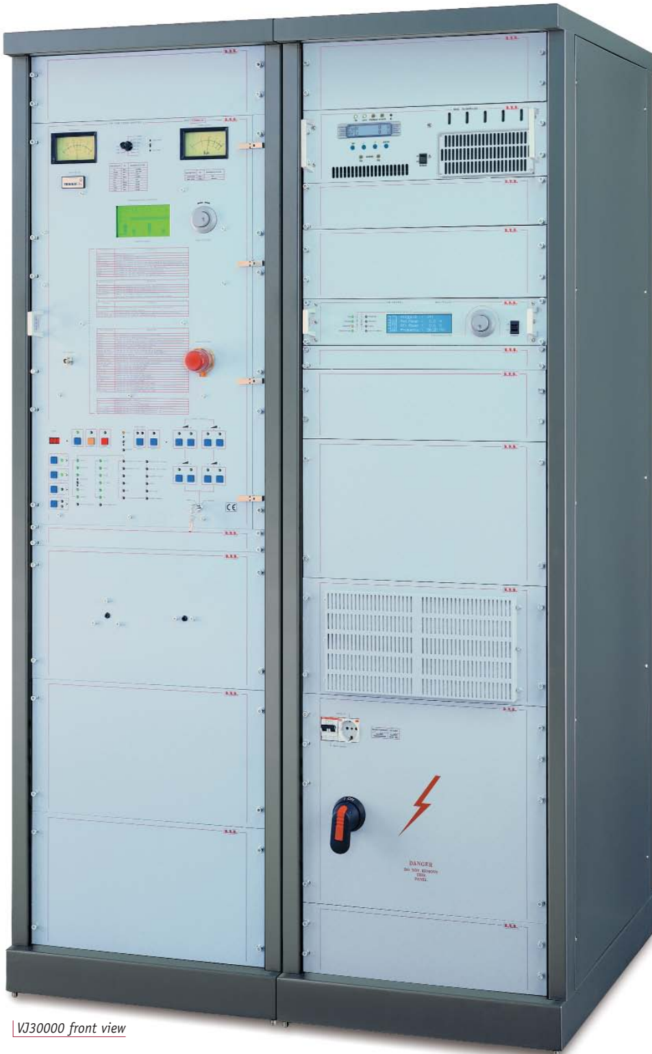
VJ30000 front view

VJ20000TE VJ25000TE VJ30000TE VJ32000TE VJ35000TE