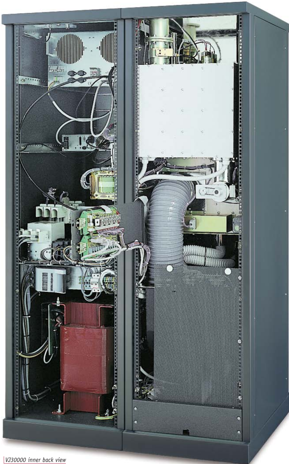
VJ30000 inner back view

VJ20000TE VJ25000TE VJ30000TE VJ32000TE VJ35000TE