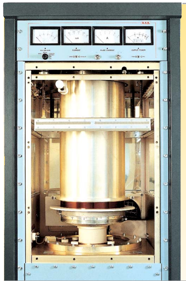
VJ30000 inner view ←