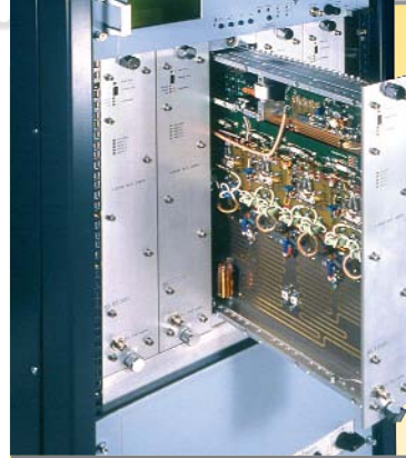
← Plug-in series RF modules amplifier compartment view