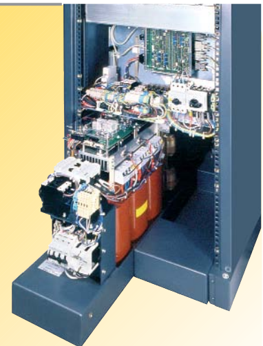
→ Plug-in series Power supply carriage view