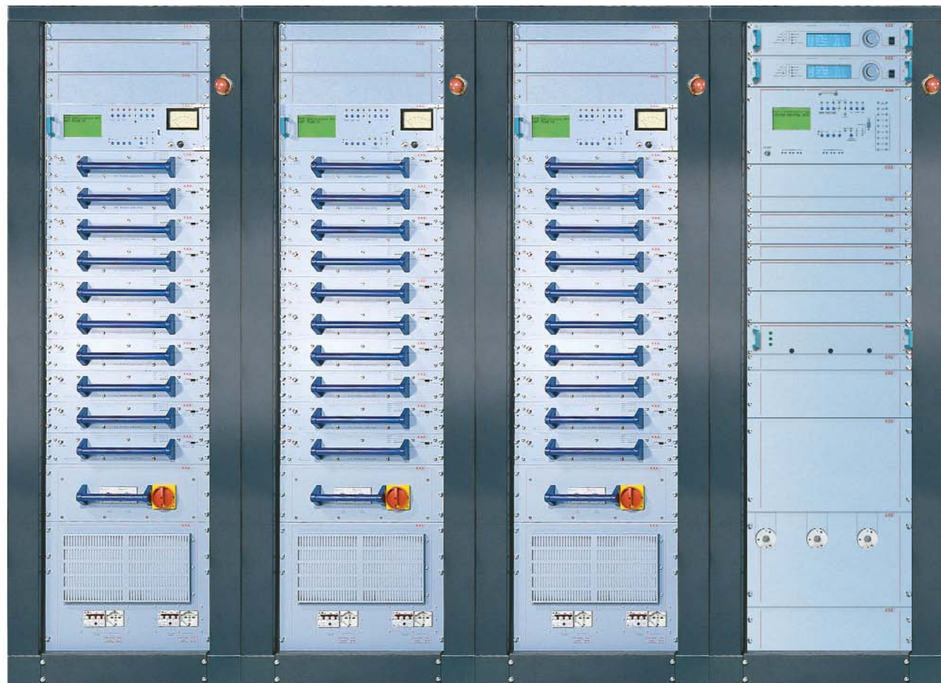
PJ35KPS-C front view

in funzionamento normale erogano il 60 % della corrente richiesta dal funzionamento della macchina, mentre in caso di assenza o guasto di uno dei due, il modulo funzionante eroga da solo tutta la corrente necessaria. Nella configurazione a 10 Kw il doppio alimentatore non è opzionale e in caso di rottura di uno di essi il trasmettitore continua a funzionare a potenza ridotta, pari al 60 % della potenza nominale. L'amplificatore è in grado di funzionare regolarmente anche in caso di assenza dell'unità di controllo. Questa può infatti essere sostituita temporaneamente da un'interfaccia elettromeccanica.