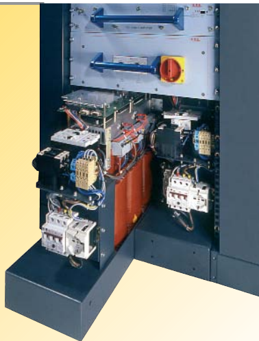
→ Plug-in compact series Power supply carriage view