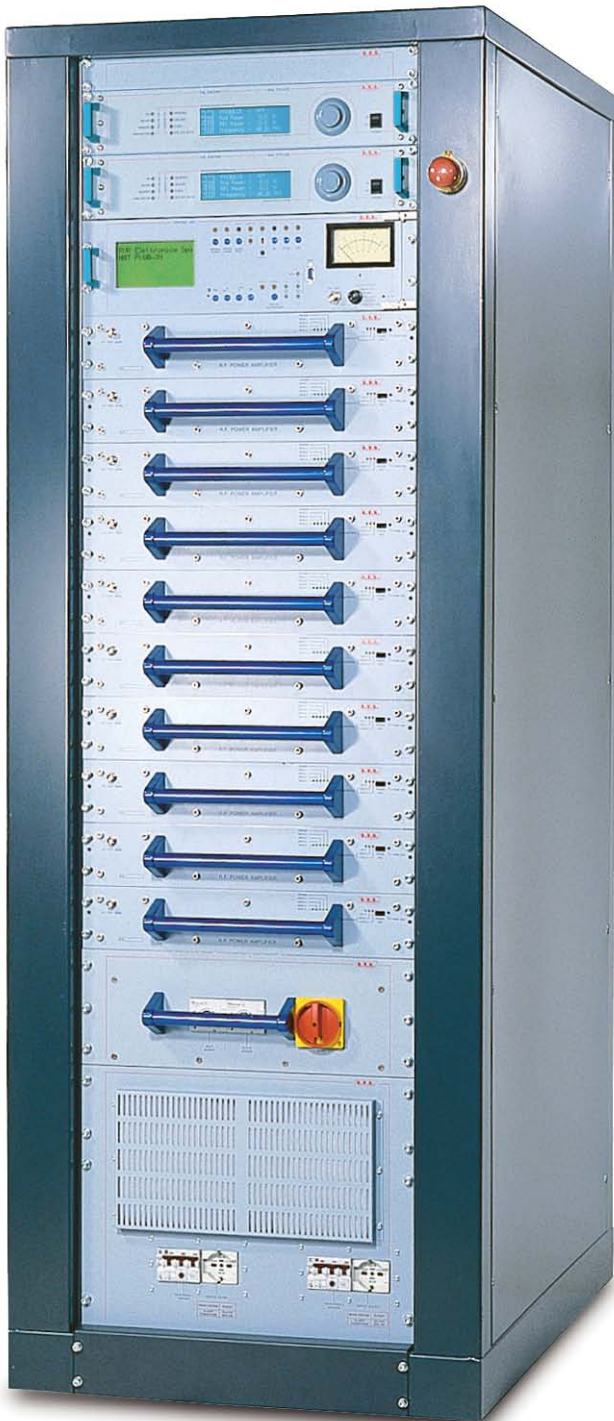
TX10KPS-C front view

TX10KPS-C TX25KPS-C TX12K5PS-C TX30KPS-C TX20KPS-C TX35KPS-C