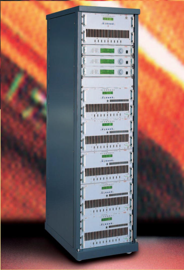
PJ 5000 M with PTX 100 LCD/S exciter