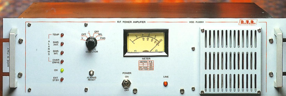
FM Mosfet Amplifier 87.5-108 MHz range

AMPLIFIERS TRANSMITTERS ANTENNAS ACCESSORIES