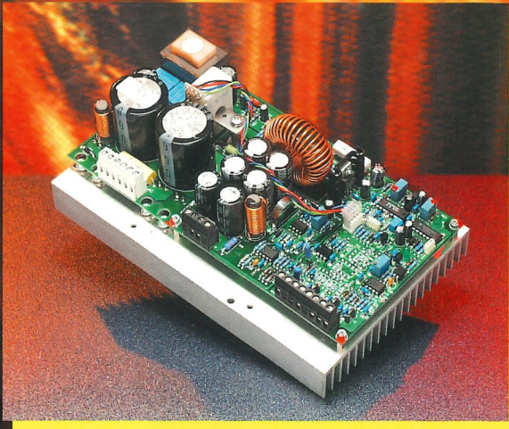
Switching Power Supply