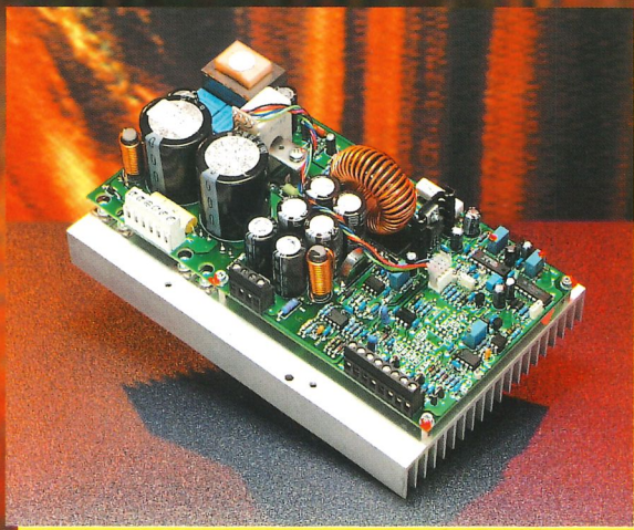
Switching Power Supply